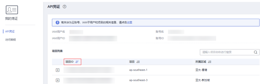
图 6-1 查看项目 ID